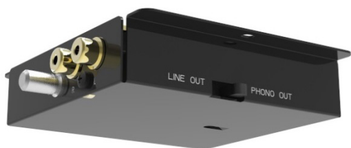
Integrierter Phono-Vorverstärker Umschaltbar zwischen Phono und Line Level Ausgang

Der T1 von Pro-Ject Audio Systems ist der erste Plattenspieler der T-Line, der für wenig Geld bereits echte HiFi Klangqualität liefert. Dieser glänzt mit hochwertigen Materialien, einem stylischen Aussehen und einem unglaublich lebendigen Sound. Während des umfangreichen Entwicklungsprozesses wurde akribisch darauf geachtet, dass trotz des unglaublichen Preises keine Kompromisse in Sachen Klangqualität gemacht werden. Im Vergleich zum Standard T1-Model, verfügt die Phono SB Version über einen integrierten, von Pro-Ject entwickelten, hochqualitativen MM Phono-Vorverstärker und eine elektronische Geschwindigkeitsumschaltung zwischen 33 und 45 RPM.