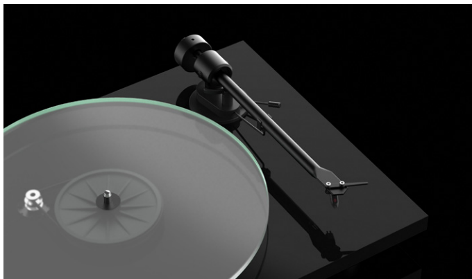
Einteiliger Aluminiumtonarm Robuste und steife Konstruktion für glasklaren Sound

Der vormontierte Ortofon OM 5E Qualitäts-Tonabnehmer mit elliptischem Nadelschliff macht diesen Plattenspieler zum einem echten HiFi Wiedergabegerät ohne Kompromisse.