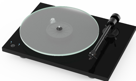
Ausgezeichnete Verarbeitung, stylisches Aussehen und audiophiler Klang; Präzisionsgefertigtes Gehäuse und schwerer resonanzarmer Glasplattenteller

Das stylische, CNC gefräste Chassis, in Hochglanz Schwarz, matt Weiß & Walnuss erhältlich, enthält keinerlei Plastikteile und wird gänzlich ohne Hohlräume gefertigt, sodass keine unerwünschten Vibrationen im Chassis auftreten können.