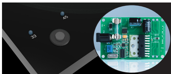
Elektronische Geschwindigkeitsumschaltung zw. 33/45 RPM DC/AC Motorsteuerung für genauen und präzisen Antrieb

Wobei viele andere Plattenspieler unregelmäßige Gleichstrommotoren mit massiven Gleichlaufschwankungen eingebaut haben, verfügt der T1 Phono SB über unseren etablierten, elektronisch geregelten, präzisen Wechselstrommotor. Der T1 Phono SB hat darüber hinaus eine elektronische Geschwindigkeitsumschaltung zwischen 33 und 45 RPM. Dieses System garantiert einen geräuscharmen, stabilen Antrieb des Plattenspielers.