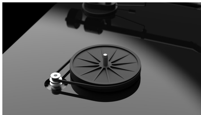
Besonders präzise Motor- und Subteller-Konstruktion

Der Plattenteller des T1 wird per Riemen angetrieben. Dieser überträgt präzise die Antriebskraft auf den neu designten Subteller, welcher wiederum in dem ultra-präzisen 0,001mm Plattentellerlager mit einem gehärtetem Edelstahlschaft in einer Messingbuchse sitzt; genau wie in unseren bewährten Essential III Modellen. Damit bietet der T1 - neben seinem laufruhigen Motor - eine stabile und resonanzarme Plattform für Tonarm und Tonabnehmer.