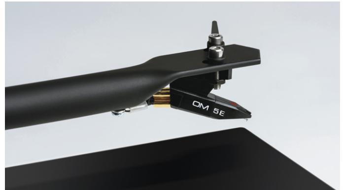
Hochqualitativer Ortofon OM 5E MM Tonabnehmer mit elliptischem Stylus

Darüber hinaus wird der T1 nicht - wie oft üblich - nur mit einfachen Cinch Kabel ausgeliefert. Im Lieferumfang sind nämlich hervorragend abgeschirmte, quasi-symmetrische, niederkapazitive Phono Kabel, welche von Pro-Ject speziell für den Anschluss von Plattenspielern konzipiert wurden, enthalten. Zudem befindet sich auch eine Staubschutzhaube, für zusätzlichen Schutz des T1 und eine Filzmatte, die als weiche Auflagefläche für Ihre Platten dient, im Paket.